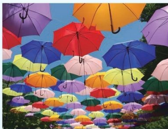
館林市役所「城町食堂」前のアンプレラスカイ。

そのようななか、新型コロナウイルスが発生しました。しかし、皆さんが感染予防のためにあらゆる機会を通して声を掛け合い、自粛をしながら創意工夫によって一日一日を過ごされています。これからも感染予防を通して、未来のための取り組みを進めて参ります。皆さまのご理解とご支援をお願いいたします。多様な方々が織りなす館林のまちづくりと一緒に進めてまいりましょう。